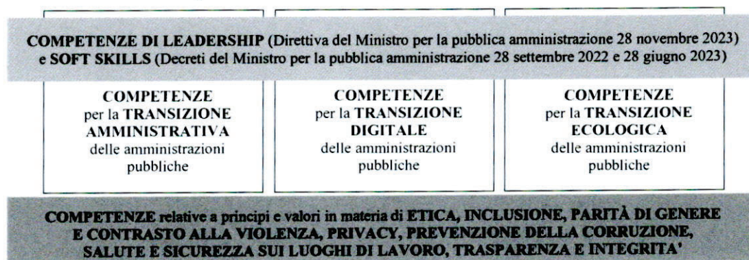
FIGURA 1 – Le aree di competenze trasversali del personale pubblico nella strategia del PNRR

La complessità dei processi di cambiamento che le amministrazioni devono promuovere e gestire richiede l’acquisizione, da parte delle persone, di conoscenze e competenze che attraversano tutte le diverse aree sopra individuate. Lo stesso termine “transizione” restituisce il senso di un mutamento radicale quale possibile esito di una pluralità di processi di cambiamento che agiscono sinergicamente.